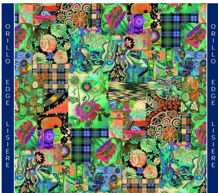
TIZIAN KERALA Referencia 034105334

Composición: 100%PES Ancho útil en cm.: 140 cm. Repetición del dibujo (altura): 179,3 Repetición del dibujo (ancho): 140 Repetición para el corte cm.: 179,3 Orientación del dibujo: Urdimbre Peso m 2 : 443 Adecuado para tapicería. Abrasión 30000 ciclos Martindale. Solidez a la luz: 5/6 Pilling: 4/5 Encogimiento (urdimbre): -0,10 % Encogimiento (trama): -0,40 %