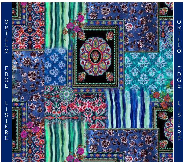
TIZIAN KOLIBRI Referencia 034105204

Composición: 100%PES Ancho útil en cm.: 140 cm. Repetición del dibujo (altura): 96,2 Repetición del dibujo (ancho): 140 Repetición para el corte cm.: 96,2 Orientación del dibujo: Urdimbre Peso m 2 : 443 Adecuado para tapicería. Abrasión 30000 ciclos Martindale. Solidez a la luz: 5/6 Pilling: 4/5 Encogimiento (urdimbre): -0,10 % Encogimiento (trama): -0,40 %